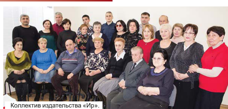
Коллектив издательства «Ир».

В издательстве трудятся всего 20 человек, но все являются профи-